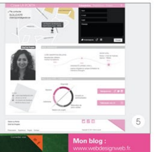
Mon blog : www.webdesignweb.fr

ainsi, je n'ai aucun problème à désigner un site puis à le programmer. J'aime bien avoir la main mise sur un projet et le réaliser de A à Z. Par exemple, lorsque je construis une maquette sur Photoshop, j'anticipe la manière dont je vais l'intégrer, ce qui me fait gagner un temps considérable. J'aime allier le design à la programmation. Je ne peux me passer ni de l'un, ni de l'autre.